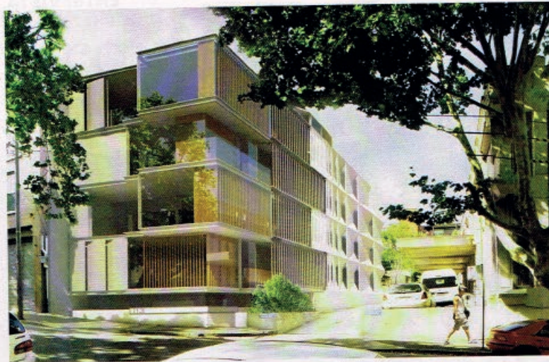
Proyecto de departamentos en Cooper Street, Sydney.