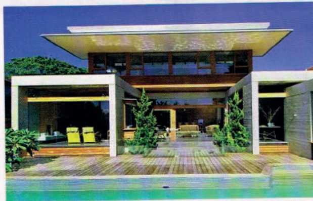
La permeabilidad fue un elemento importante en el diseño de la casa Gibson en Sydney.