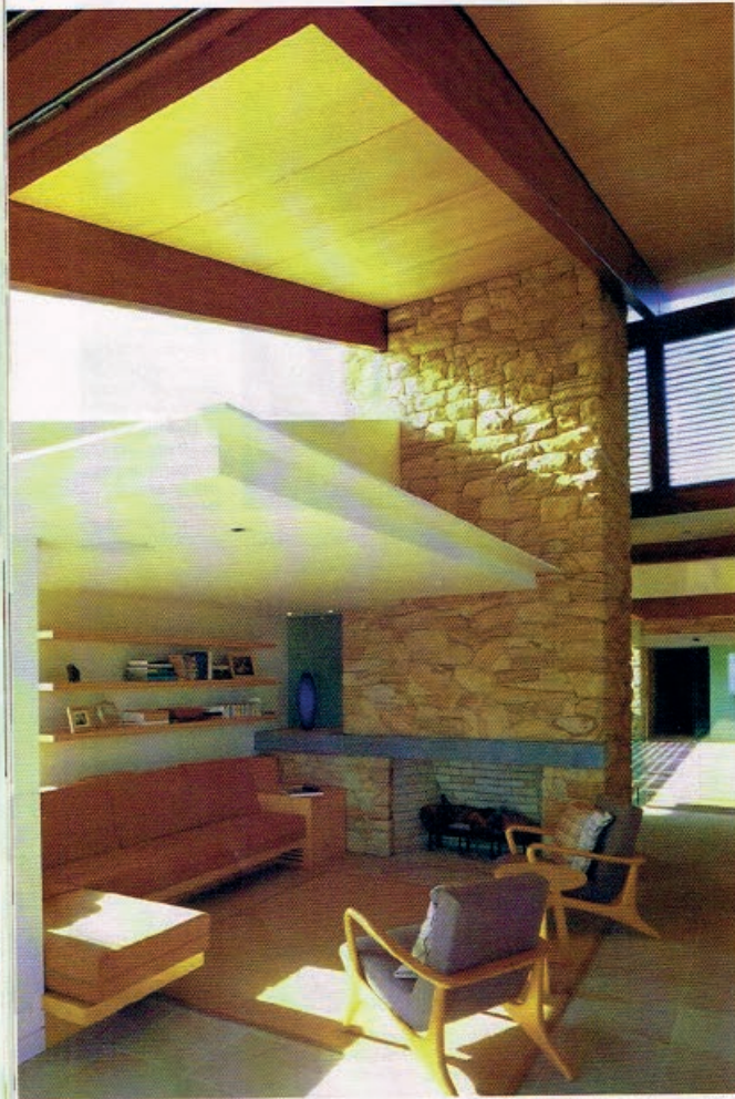
En este proyecto se emplearon materiales y un colorido muy acorde al paisaje australiano.